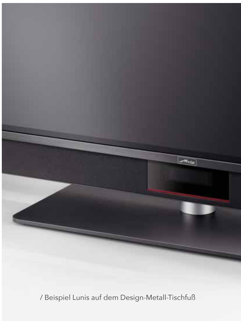
/ Beispiel Lunis auf dem Design-Metall-Tischfuß